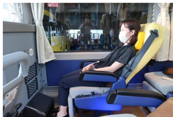
リクライニングもしっかり倒せてお寛ぎ頂けます