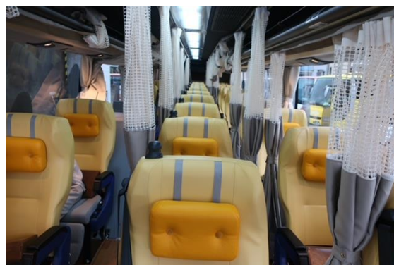
トレードマークの黄色い車体に、黄色い LIMON カラーのゆったりワイドシート